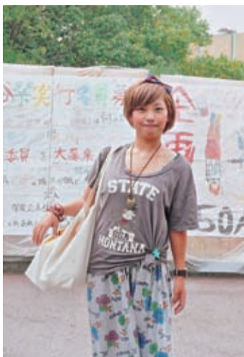
彼女が希望する職種は、英語に携われる職種。貿易関係の商社とか旅行会社などを希望している。ただ、大卒者の就職が大変厳しく、書類だけで落とされてしまうこともある、と言う先輩の話も聞かされて、それだけに、英語だけはきちんと勉強しておきたい。