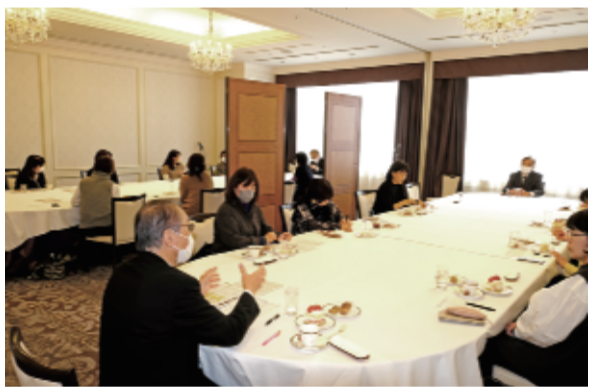
コロナ禍で中止されている「高校奨学生と保護者のつどい」の代替補完行事として「語りらいラウンジ」=写真=が昨年11、12月、名古屋、福岡市で開かれた。(3面に関連記事)

か、マスメディアへの露出を増やすなど知名度向上に努めた。ホームページもリニューアルした。