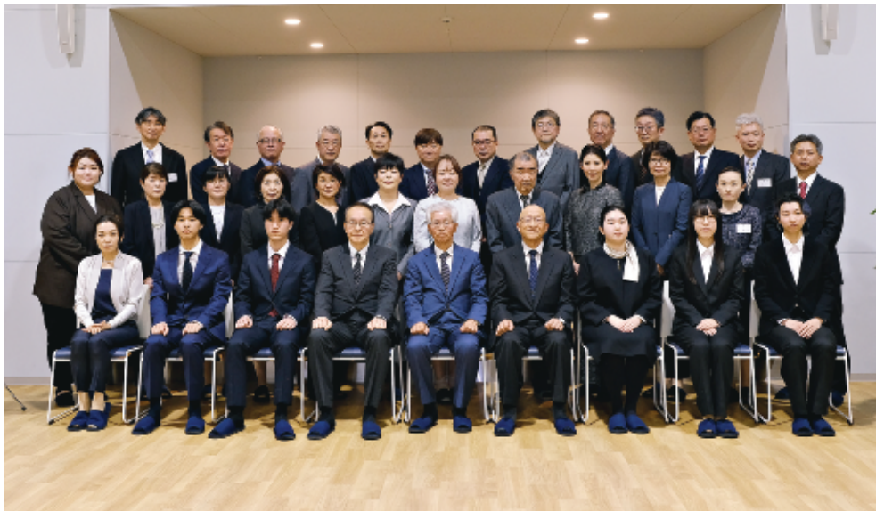
【心塾東京寮で4月4日】

【敬称略、順不同】 また、「米国で日本の良さを伝えるなら」との問いには「和食」と答えた生徒が最多。日本人の礼儀正しさや細やかな気遣い、街の清潔さ、治安の良さ、アニメ文化なども美点として挙がった。 一行は7月18日に東京・羽田空港を出発、8月8日に帰国する予定。