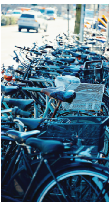
国内の自転車保有台数は約7000万台。交通ルールの順守が求められる。（イメージ写真）

アパートなどで一人住まいをする奨学生の家賃補助（月額1万5000円）を今年度から同3万円に増額する。資格取得、検定試験の受験料全額補助も要望に応じて随時拡充しており、国家資格な