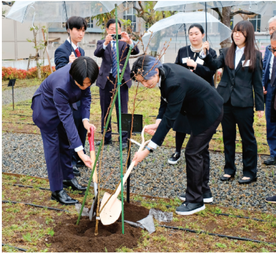
今春、大学、専門学校などに進学した交通遺児育英会の奨学生16人(東京7人、関西9人)が東京、関西の学生寮「心塾」に入塾し、4月に入塾式が行われた。式典には石橋健一会長や当会職員が出席して新入生を激励。東京寮の中庭では恒例の記念植樹が行われ、入塾生はシャベルを順番に持ち替えてシデコブシを植えた=写真は4月4日、東京寮で。東京、関西の心塾生は新入生を含めて計83人になった(4月1日現在)。(3面に関連記事)